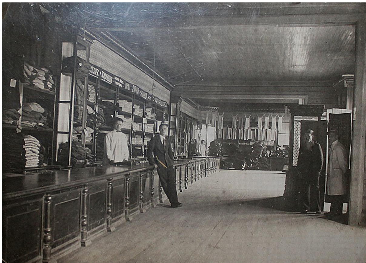
Начало XX века. Интерьер магазина.