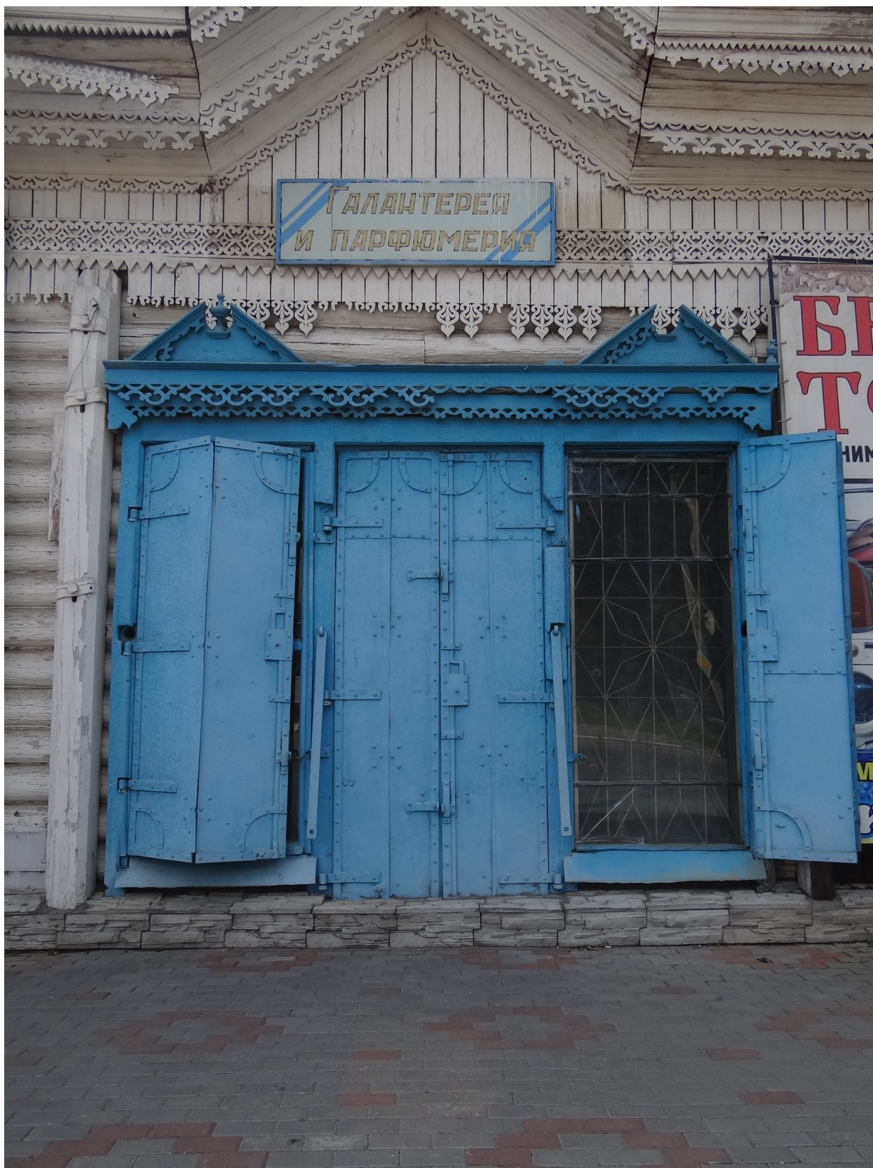
Окованные ставни и пропильная резьба.