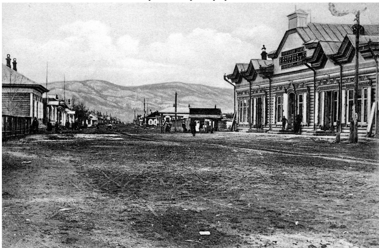
Начало XX века.