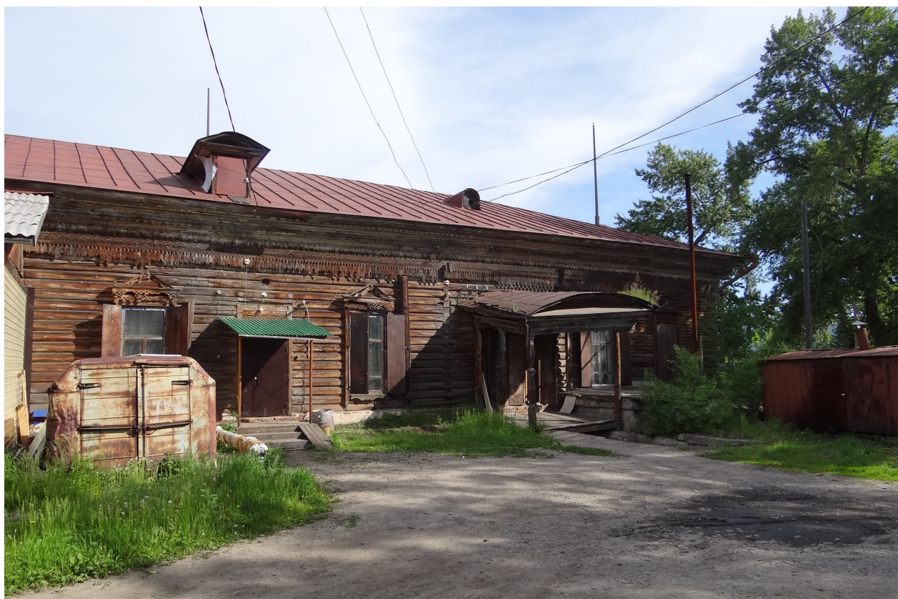
Фрагмент дворового фасада.