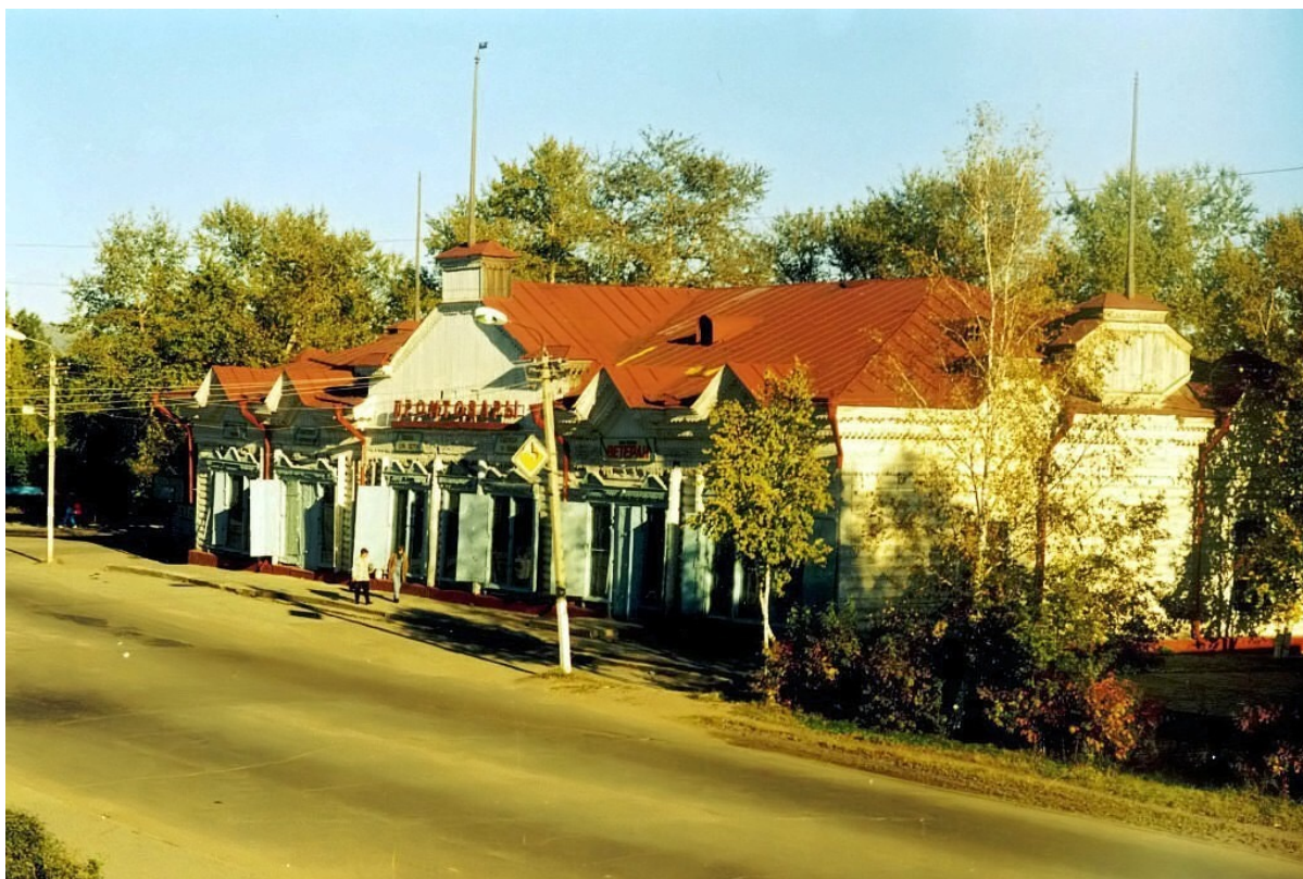
Вторая половина XX века.