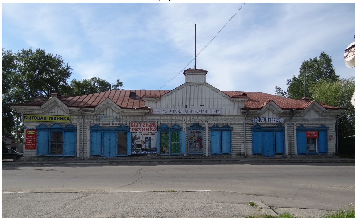
Северный (главный) фасад.